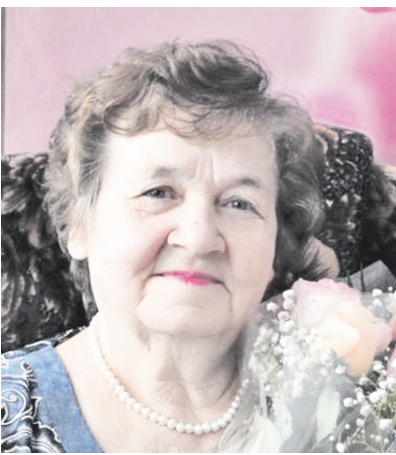
Коллектив МОУ Старобесовской ООШ им. А.Ф.Юртова

Примите наши самые теплые поздравления с юбилеем! Пусть накопленный опыт и мудрость помогут достичь вам новых высот! Желаем, чтобы Удача, Успех и Вдохновение всегда были вашими