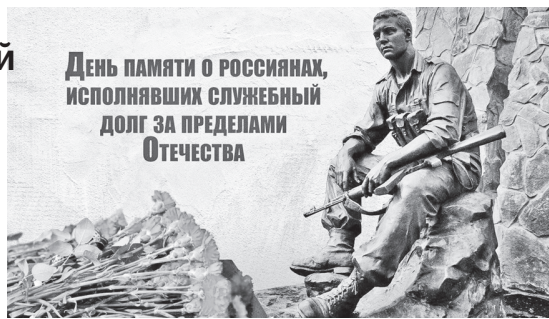
День памяти о россиянах, исполнявших служебный долг за пределами Отечества

Мы помним и чтим память тех людей, которые защищали наши интересы за пределами нашей Родины, прежде всего, тех, кто