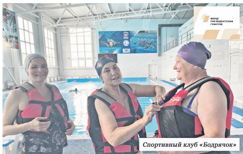
Спортивный клуб «Бодрячок»

- В Новомалыклинском районе в 2023 году были реализованы три грантовых проекта на общую сумму 1 330,1 тыс. рублей: проведение фестиваля «Играй гармонь родная» в ТОС «Абдреево», проект «Большой заплыв» Спортивного клуба «Бодрячок» в ТОС «Черемшан» и проект «Живи река» ТОС «Новая Малыкла». В 2024 году на первый конкурс Фонда президентских грантов от ТОС Новомалыклинского района подано восемь заявок. Четыре из них – на благоустройство территории памятников Великой Отечественной войны в селах Старая Тюгальбуга, Старая Бесовка и Абдреево, расчистку реки в селе Средний Сантимир. Еще четыре – на конкурс президентского фонда культурных инициатив: