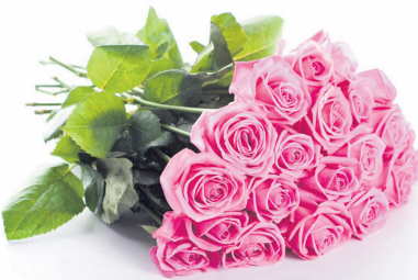
Мечты твоей заветной исполнения И бесконечного тепла в твоей душе!

Дорогой наш, любимый человек! С юбилеем! Пусть здоровье твоё будет крепким, благополучие - вечным, удача - неизменной, а успех - постоянным!