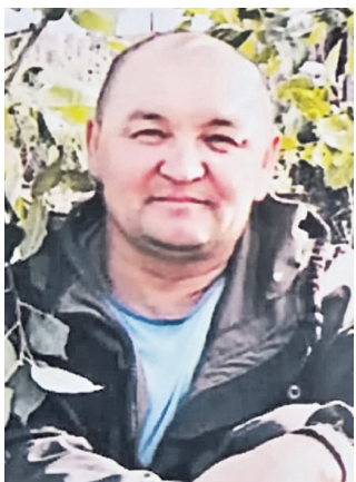
С любовью родители, жена, дети, брат, сестрёнка, племянники.

День рождения юбилейный, Праздник полувековой! Проведи в кругу семейном, Как глава семьи большой. Поздравляем мы супруга, Сына, брата и отца! Не страшны с тобой нам выюги, Ведь рука твоя крепка. Желаем в жизни только счастья, Удачи, смеха, радости, тепла! Пусть стороной обходят все ненастья, И рядом будет вся твоя семья! Желаем, чтобы все мечты сбывались, Здоровье чтоб не подводило никогда, И как стремительно года б твои ни мчались, Ты оставался молодым всегда-всегда! Мы любим и ценим тебя, наш родной, Мы верим в тебя и гордимся тобой!