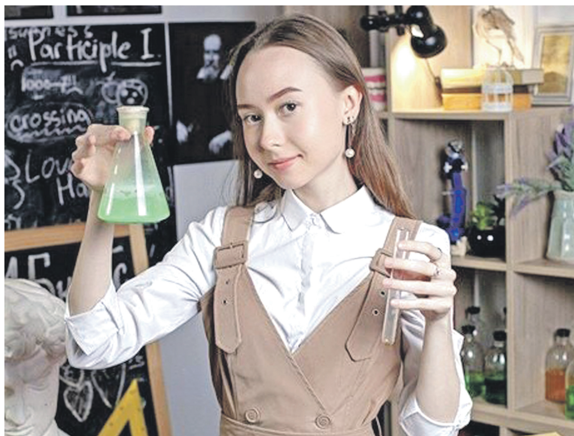
■ Ульяновская школьница вдохновилась работой акушерок и сдала ЕГЭ на 296 баллов.