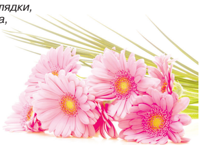
С любовью дети и внуки.

Дни бегут, как ветер, без оглядки, Светит солнце и метут снега, Только знаешь, на любом десятке, Ты для нас все также дорога. Всем нужна, никем не заменима, Любим очень-очень мы тебя, Пусть печали пронесутся мимо, Будь здорова, береги себя.