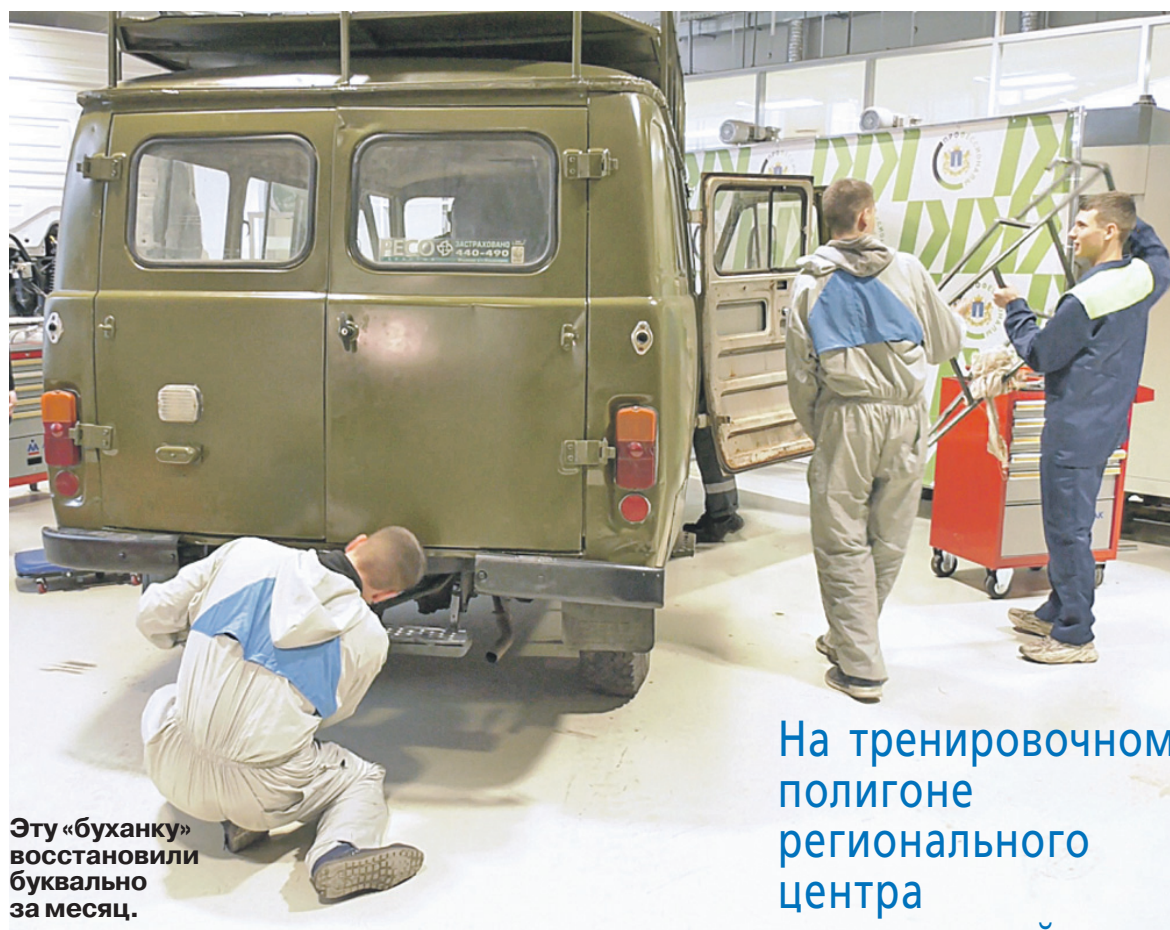
Эту «буханку» восстановили буквально за месяц.

Еще одно «тыловое подразделение» волонтерского движе-