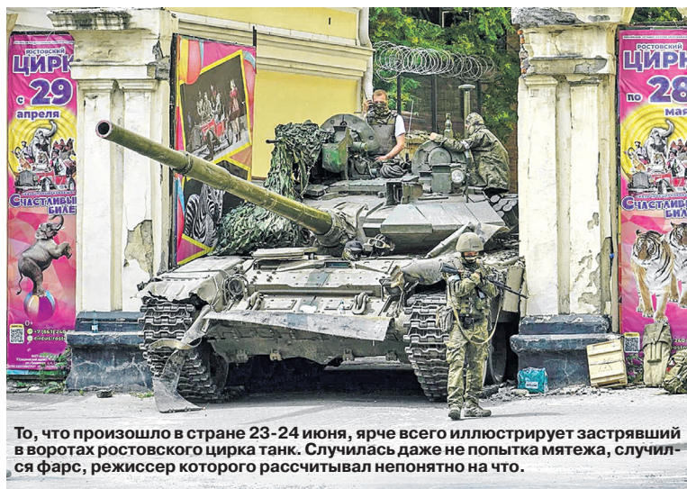
То, что произошло в стране 23-24 июня, ярче всего иллюстрирует застрявший в воротах ростовского цирка танк. Случилась даже не попытка мятежа, случился фарс, режиссер которого рассчитывал непонятно на что.

Всего с начала проведения специальной военной операции уничтожено: 444 самолета, 240 вертолетов, 4812 беспилотных летательных аппаратов, 426 зенитных ракетных комплексов, 10395 танков и других боевых бронированных машин, 1132 боевые машины реактивных систем залпового огня, 5254 орудия полевой артиллерии и минометов, а также 11256 единиц специальной военной автомобильной техники.