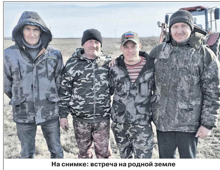
На снимке: встреча на родной земле

- Как проходит служба, как настроение ребят, с которыми