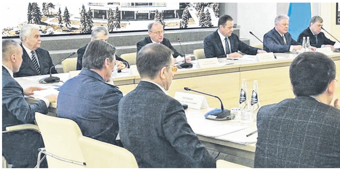
В Ульяновске секретарь Совета безопасности Российской Федерации Николай Патрушев провел совещание по актуальным вопросам обеспечения национальной безопасности в Приволжье.

Участники совещания обсудили тематику, связанную с повышением правовой грамотности населения, а по его итогам даны поручения по разработке и реализации программ поддержки научных и социальных проектов, позволяющих купировать попытки стран Запада осуществлять манипулирование