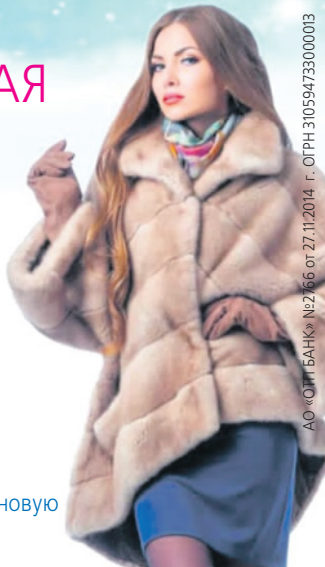
АО «СМТ БАНК» №2766 от 27.11.2014 г. ОГРН 31059473000013

Скидки до 50% ОГРОМНЫЙ ВЫБОР ШУБ из меха норки, мутона, бобра, кёрли, астрагана. ЖЕНСКИЕ И МУЖСКИЕ ДУБЛЕНКИ. Производство: Турция, Греция, Россия. Модельный ряд до 72 размера. ГОЛОВНЫЕ УБОРЫ. Кредит по паспорту без первого взноса, через терминал. Акция «Меняем старое на новое» «Сдай старую шубу и получи скидку на новую до 35000 руб.» СКИДКИ ВСЕМ ПЕНСИОНЕРАМ!