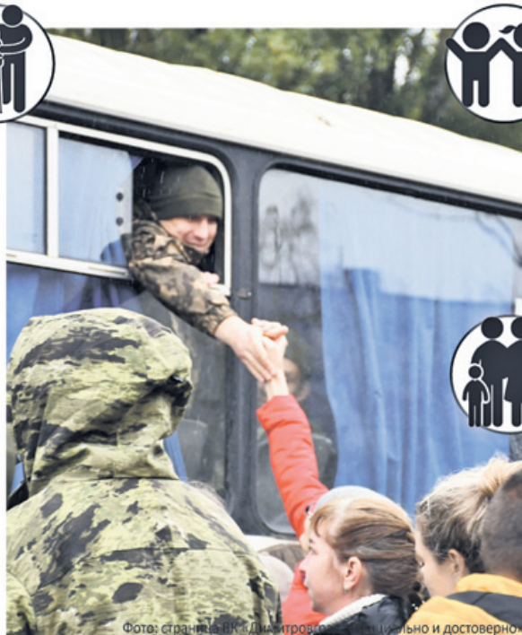
Фото: страница 117. Демонстрируется открыто и достоверно.