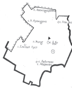
Графическое изображение схемы избирательного округа для проведения выборов депутатов Совета депутатов муниципального образования «Высококолковское сельское поселение» Новомалыклинского района Ульяновской области