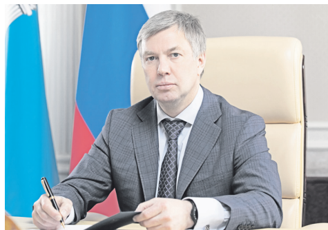
23 родника Ульяновской области приводят в порядок в 2022 году