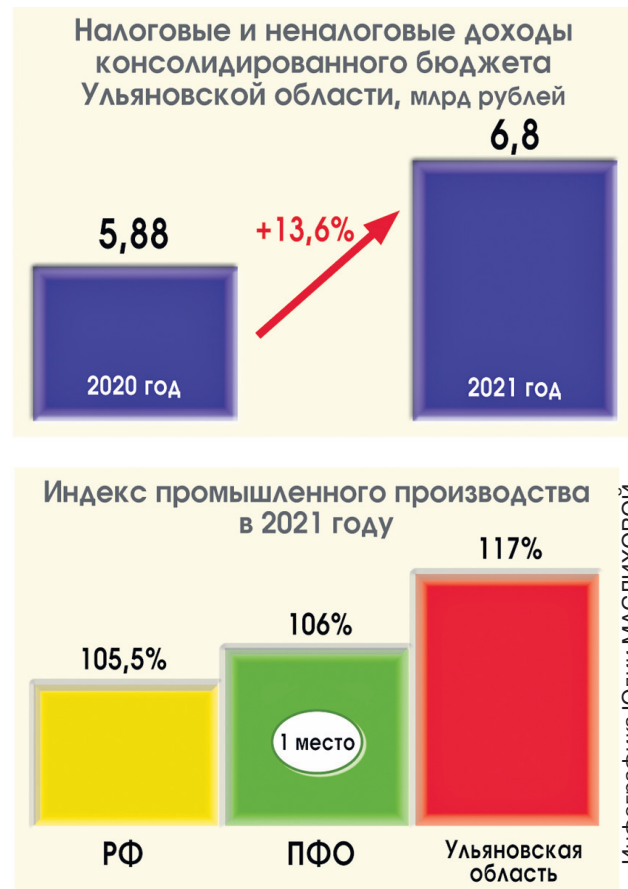
Инфографика Юлии МАСЛИХОВОЙ

Кстати, такой же рейтинг был присвоен и выпуску облигаций Ульяновской области. Ульяновская область - третий регион, который в 2021 году привлекает средства инвесторов через финансовые рынки.