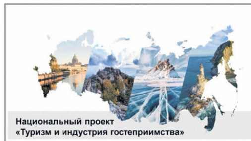
Национальный проект «Туризм и индустрия гостеприимства»

В Новомалыклинском районе в рамках тематической недели пройдет ряд онлайн-мероприятий. На этой неделе в социальных сетях участники ждут: видеоролик о достопримечательностях нашего района, виртуальные экскурсии в музеи района, фильм «Малыклинский караван» - о культуре народов Новомалыклинского района и многое другое.