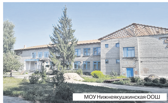
МОУ Нижнеякушкинская ООШ