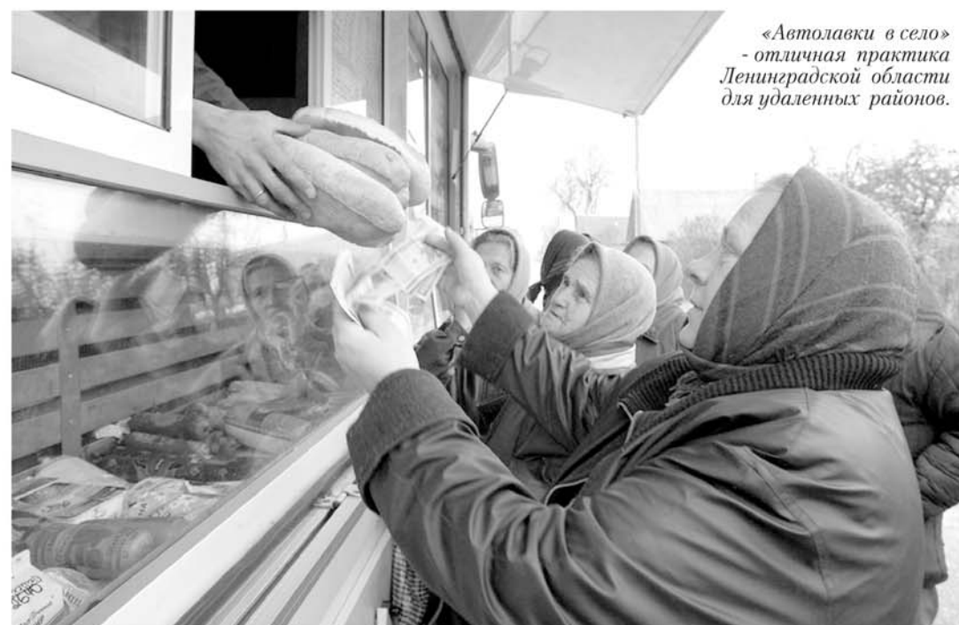
«Автолавки в село» - отличная практика Ленинградской области для удаленных районов.

ласти должны будут определиться с теми практиками, которые наиболее оптимальны для реализации на территории конкретного МО. Сейчас нельзя работать так, как работали раньше: нет времени на метод проб и ошибок».