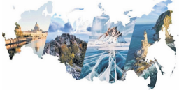
Национальный проект «Туризм и индустрия гостеприимства» — открывает туристический потенциал страны для каждого россиянина и всего мира

Также с 27 по 28 апреля в региональном центре состоялся образовательный форум «Пора путешествовать по России». Организаторами выступили Агентство по туризму Ульяновской области и ФРОС Region PR. Ульяновск стал первым городом проведения данного мероприятия. В первый день прошли обучающие семинары и практическое занятие по событийному туризму и созданию сувениров. 28 апреля состоялась заседание оргкомитета по подготовке и проведению финала X Национальной премии Russian Event Awards, панельная дискуссия «Туристические маршруты и экскурсионные программы Ульяновской области» и круглый стол «Межрегиональный туристический проект «Яркие выходные в Приволжье». Перед участниками выступил председатель Правления