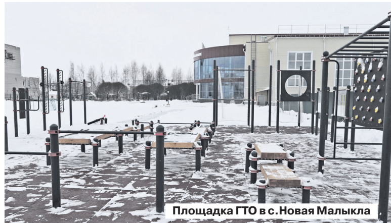
Площадка ГТО в с.Новая Малыкла

екта «Образование» в 2020 году запущены: детский технопарк «Кванториум» в Димитровграде, Дом научной коллаборации, центр цифро-