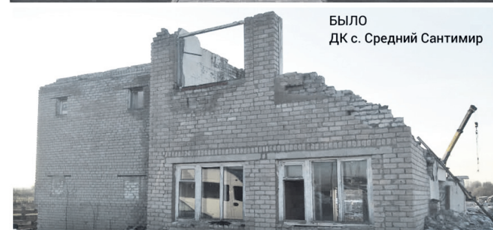
БЫЛО ДК с. Средний Сантимир

Александровка и ремонта кровли здания соцкультбыта села Старый Сантимир). В случае, если наши проекты будут поддержаны, ремонтные работы будут проведены уже в 2021 году. А также участие наших творческих коллективов в международных, всероссийских, региональных проектах и конкурсах, таких как Международный марафон искусств «Белорусский вокзал», Всероссийский конкурс исполнителей русской песни «Поющая Россия», региональные конкурсы «45 песен до Победы», «Россия - это мы!» и многих других.