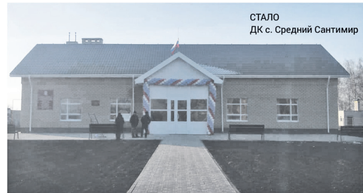
СТАЛО ДК с. Средний Сантимир

О.С.: Пандемия коронавируса нового типа существенно повлияла на культурную жизнь не только Новомалыклинского района, но и региона, страны в целом: культурно-досуговые учреждения, библиотеки, учреждения дополнительного образования в сфере искусств не могут вести свою работу в обычном режиме, как того требует муниципальное задание. С другой стороны, произошел расцвет онлайн-технологий в области культуры, артисты научились репетировать онлайн, а музыканты - выступать перед пустым залом ради последующей трансляции в интернете с тысячами невидимых зрителей. В последние месяцы мы увидели очень много того, что раньше и представить было сложно. Например, впервые в онлайн формате в этом году прошел наш знаменитый Областной фестиваль культур народов Поволжья «Малыклинский Каравай». Сотрудники учреждений культуры Новомалыклинского района с энтузиазмом приняли участие в волонтерской деятельности, в течение года принимали участие в акциях «Фронтальные бригады» в рамках проекта «Волонтеры Победы», «Во-