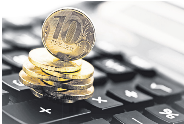
Наталья Брюханова. По материалам Пресс-службы Правительства Ульяновской области

продолжить практику стимулирования муниципалитетов из областного бюджета. Для этого будет выделено 150 млн рублей. На реализацию Проекта поддержки местных инициатив в следующем году предусмотрено 55 млн рублей. Данные средства позволят муниципальным образованиям повысить гражданскую активность населения и решить конкретные вопросы местного значения, а также выполнять наши социальные обязательства», - добавила