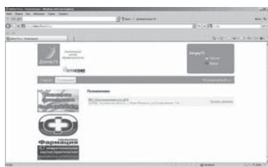
3. Выберете из открывающегося списка – Новомалыклинский район 4. Далее - Поликлиники 5. Кликните по – МУЗ Новомалыклинская ЦРБ, далее выберете - расписание