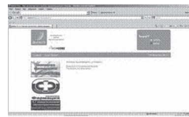
8. На двери кабинета доктора, ведущего прием, Вы увидите список граждан, записавшихся на прием через сеть интернет, обслуживаемых по времени записи на портале http://doktor73.ru/