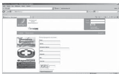
2. Зарегистрируйтесь на портале http://doktor73.ru/