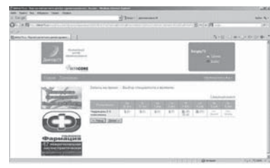
7. Выберите дату и время приема