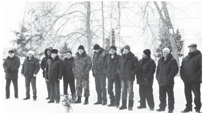
Полосу подготовила Зинаида ЛЕОНТЬЕВА, фото автора.

«... только лишь мирного неба, И близких людей никогда не терять, Чтоб было достаточно теплого хлеба, И чтоб по-другому свой долг исполнять...»