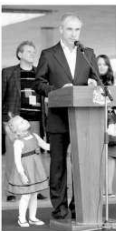
К 2030 году численность населения Ульяновской области должна возрасти до 3 миллионов. Общую задачу перед областной властью поставил Сергей Морозов. Сейчас в регионе проживают 1,267 млн человек.

- Кроме того, необходимо продумать механизм дополнительных выплат, которые молодые мамы могли бы тратить на услуги нянь.