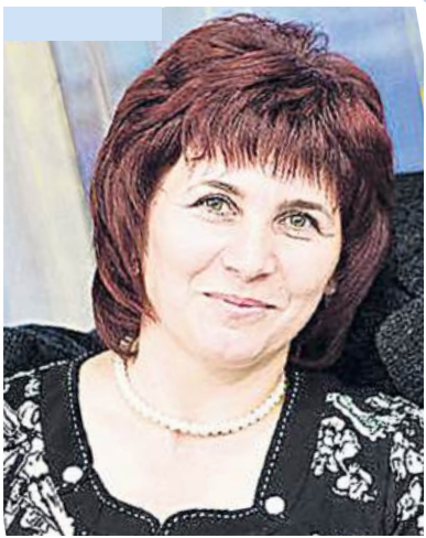
С любовью сестра, брат, племянницы и племянник

Дорогая, любимая сестренка, тётя! От всего сердца поздравляем тебя с этим замечательным событием. Желаем крепкого здоровья, семейного благополучия, всех земных благ. Живи, родная, долго-долго И не считай свои года, Пусть счастье, радость и здоровье Тебе сопутствуют всегда! Не важно, сколько лет тебе сегодня, Ведь ты чудесна всё равно. Желаем мира, доброго здоровья, И самого прекрасного, что в жизни нам дано.