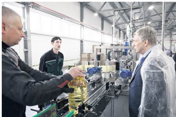
На фото: Кармалынский завод растительных масел в Новомалыклинском районе

Уже в этом году построят 18 новых ФАПов, отремонтируют поликлинику в Тереньгульской районной больнице, начнется строительство приемного отделения областного клинического центра имени Чучалова, будет введена в эксплуатацию детская инфекционная больница на Верхней Террасе. В планах - строительство центра кардиохирургии. Внедряется цифровая платформа «Здоровье» - к 2030 году не должно остаться бумажных медицинских карт. Осваивается искусственный интеллект для анализа снимков