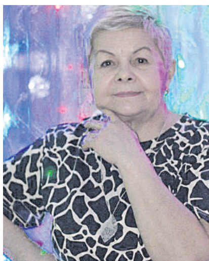
С любовью муж, дочь, внуки.

Единственной, родной, неповторимой, Мы в этот день спасибо говорим. За доброту и сердце золотое, Мы, наша милая, тебя благодарим. Пусть годы не старят тебя никогда, Мы, муж, дочь, внуки, все любим тебя! Желаем здоровья, желаем добра, Живи долго-долго, ты всем нам нужна!