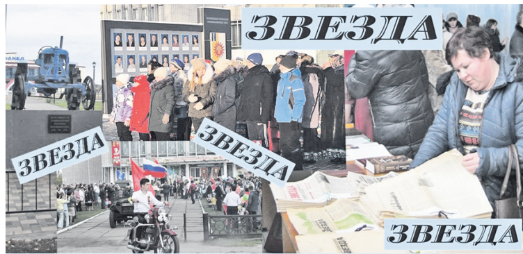
Новомалыклинская районная общественно-политическая газета. Основана 24 октября 1930 года