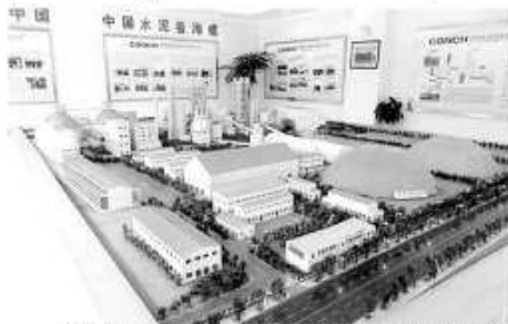
Губернатор Сергей Морозов прислушался к общественности и принял решение о переносе места под строительство завода.

Корпорация развития Ульяновской области обсудит с китайской компанией «Конч» возможность переноса строительной площадки цементного завода как можно дальше от населенных пунктов. Разработку месторождения цемента в Тереньгульском районе и возможное там строительство завода обсудили 12 сентября в Общественной палате Ульяновской области.